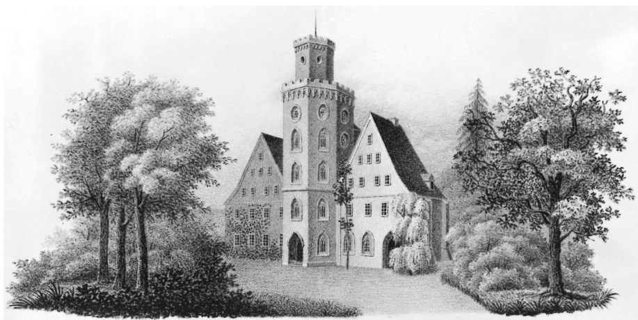
Stich des Schlosses Poschwitz

Das hauptmusikalische Ereignis, das ich in Poschwitz erlebte, war die Anwesenheit von Liszt, der einer Musikwoche in Altenburg beiwohnte, und zu den Großeltern herauskam. Er spielte dort, und ist das ein Erlebnis, was man nie vergißt.